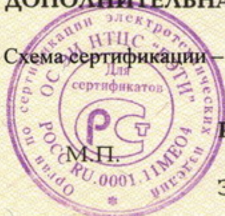
Схема сертификации — 3 Знак соответствия наносится по ГОСТ Р 50460-92 на этикетке