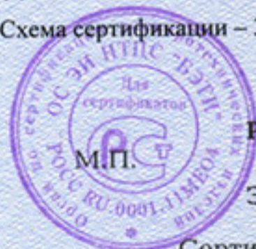
Схема сертификации – 3