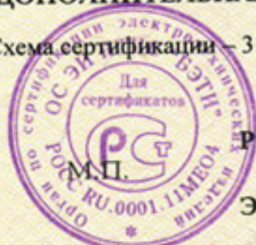
Схема сертификации – 3 Знак соответствия наносится по ГОСТ Р 50460-92 на этикетке